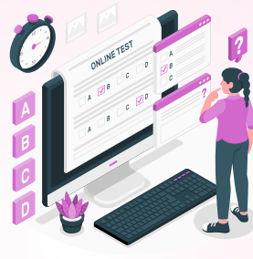
Online Test Series & Quiz