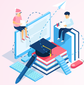
Books & Study Material